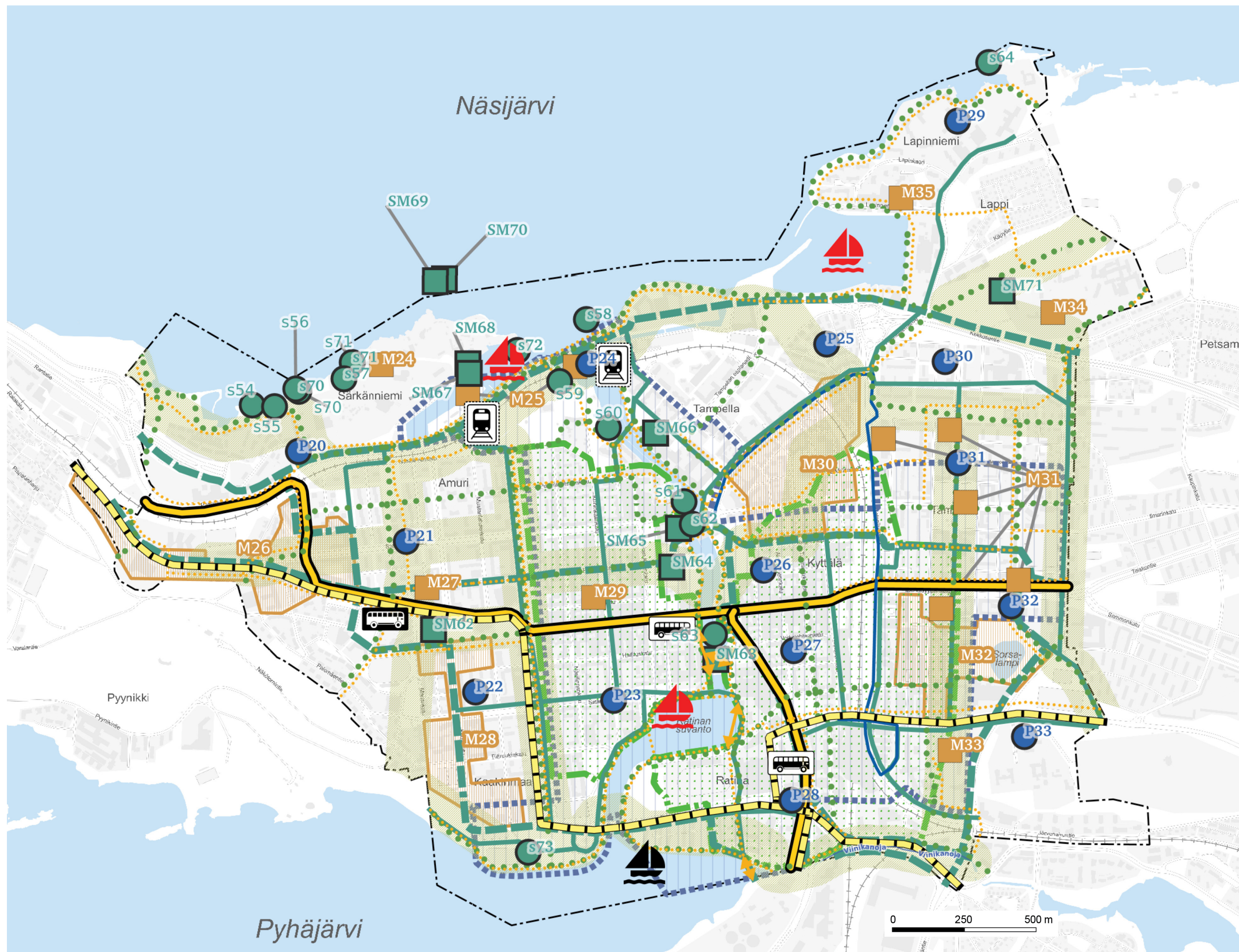
KARTTA 5 - OSA-ALUEIDEN KEHITTÄMISPERIAATTEET Keskusta